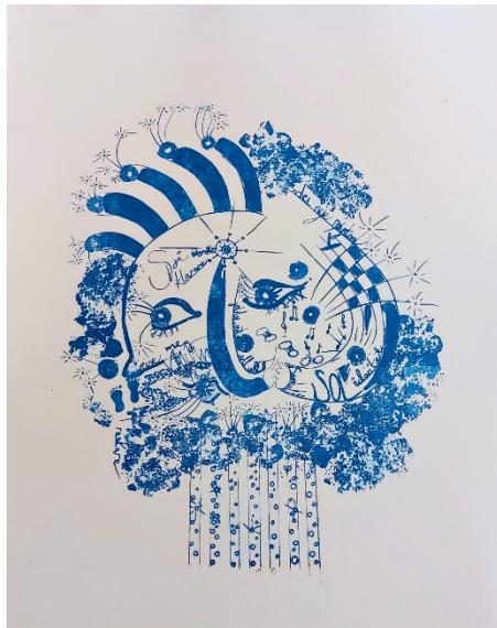
SKYt Meg : Lithographie – Karianne Brevick