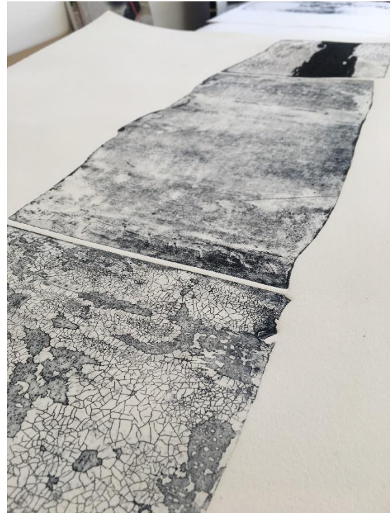
Matrice et épreuve FDE 2023 - © Christine Vandrisse