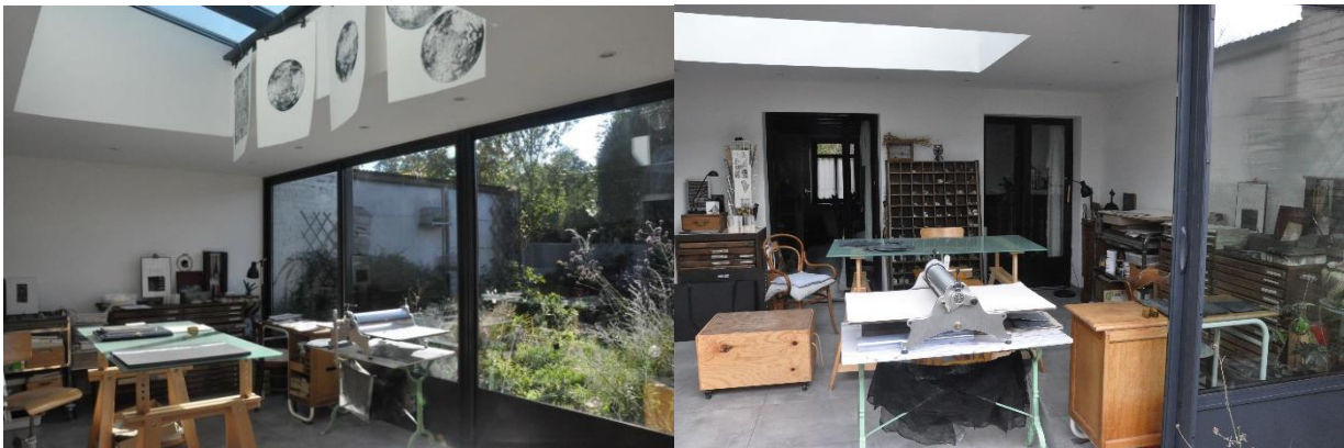
Atelier de Christine Vandrisse

L'atelier qui ouvre ses portes pour l'occasion est une extension contemporaine offerte par les Vandrisse à leur maison flamande, ancienne demeure de tisserand du XVIII ème siècle. Inaugurée le 26 mai 2019 lors de la Fête de l'Estampe, ce lieu clair et largement ouvert sur le jardin et la maison est un beau lieu de vie et de travail. L'atelier est équipé pour la typographie de casses essentiellement Police Caravelle Corps 8 à 36, d'un lingotier, d'une presse à tirage d'épreuve, d'une presse de reliure, acquisitions ou dons auprès d'anciens imprimeurs ou musée et pour la taille douce d'une Presse de Chartreuse 500 n°620. C'est dans cette maison que Christine Vandrisse a créé les Editions d'Émérance en février 2011, Émérance est le prénom d'une de ses arrière-arrière-grand-mère d'origine flamande. Quelques éditions de livres d'artiste sont également présentées.