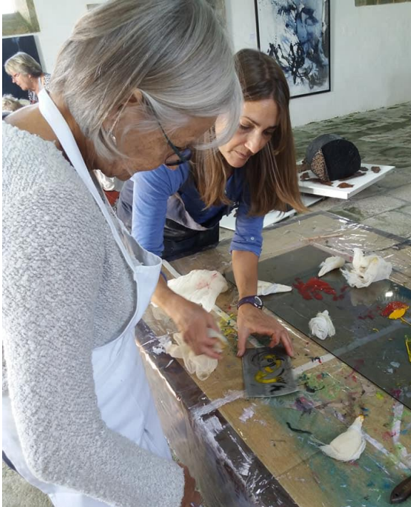
Stage sur Tetra Pak

Un événement de la 12 e Fête de l'estampe mis en lumière