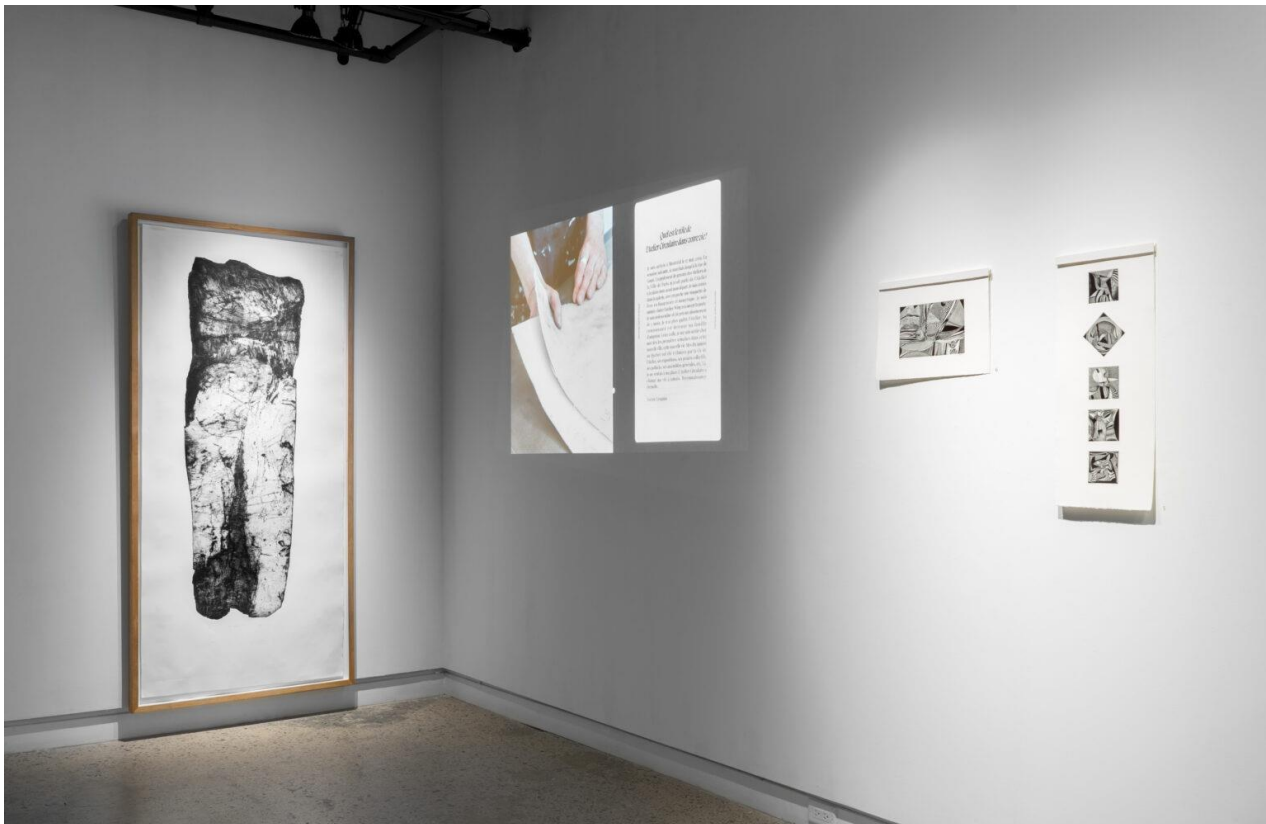
1 – Espace magasin arts imprimés / 2 – Espace serigraphie / 3 – Exposition Fabriquer quatre décennies : commissaires Andes Beaulé et Paule Mainguy - 2023