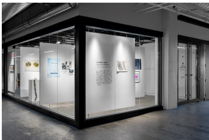
1 - Atelier taille-douce