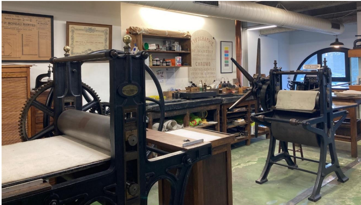
1 – MAI : Presse à cylindre Voirin / 2 - Presses taille douce