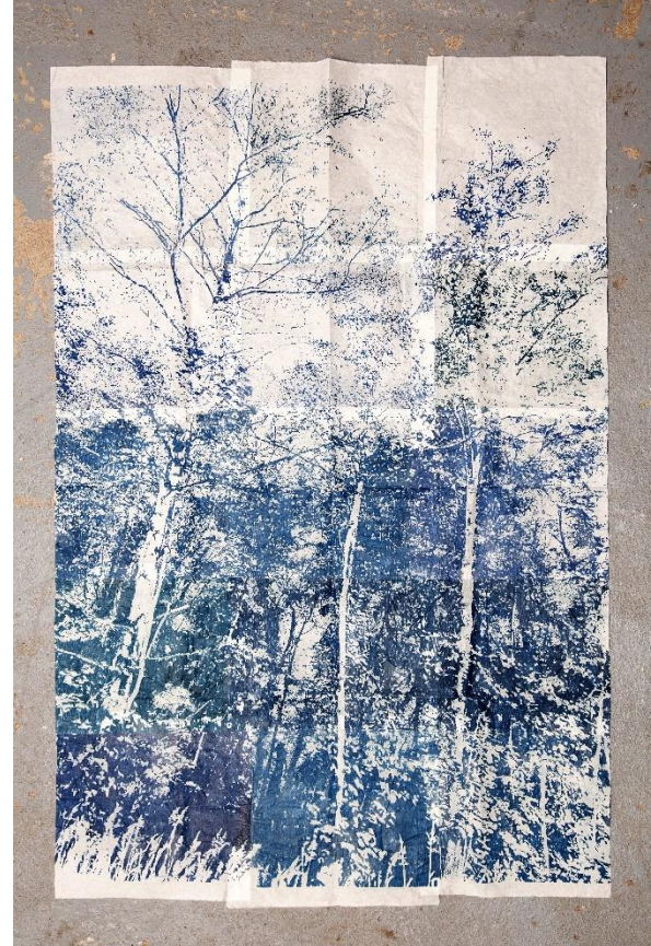
Amélie Vidgrain : Je suis ce que j'observe I , 2023 monotype sur verre à l'encre taille-douce, 100x70 cm © Lucie Pastureau - Hans Lucas – ADAGP