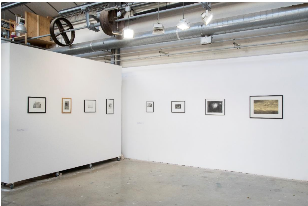
Accrochage de l'édition 2023 – Fête de l'estampe à la Villa Belleville