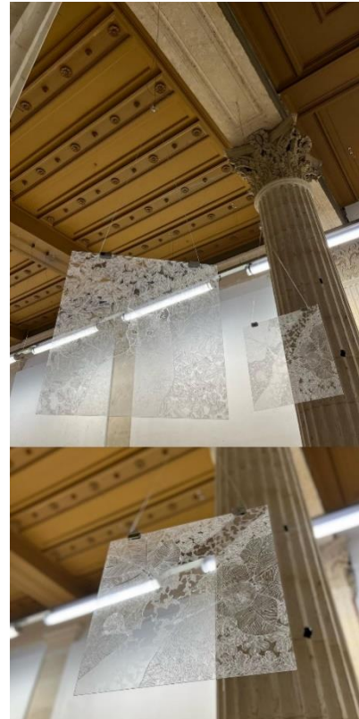
Fenêtres Gravures sur plexiglas 50x50 cm 2023