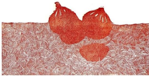
Les figues Estampes (gravures en relief sur pvc mousse) 27x32cm 2023