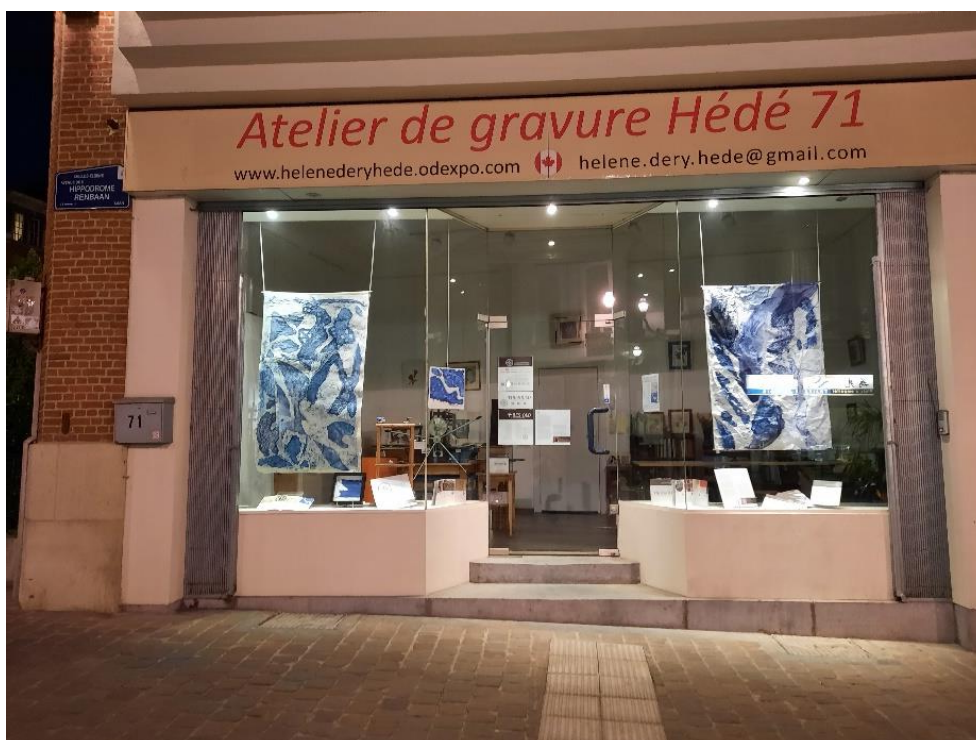
Atelier Hédé 71

L'atelier de Gravure d'Hélène Déry - Hédé 71 est situé à un endroit stratégique à Ixelles, commune de Bruxelles, entre la Place Flagey et sa grande salle de spectacles où l'on célèbre le concours de musique de la Reine Elisabeth, l'Université Libre de Bruxelles, et l'Abbaye de La Cambre avec son Académie des Arts plastiques, ce qui constitue un triangle artistique exceptionnel qui favorise les rencontres.