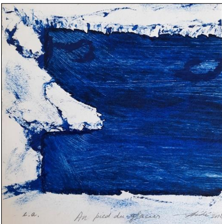
Dance avec les glaces côté 2- 2021 © Hélène Déry Au pied du glacier - gravure sur masonite 2018 © Hélène Déry

À travers ses œuvres imprimées, collages, empreintes, peintures et installation, Hélène Déry s'inspire de la nature et de la matière pour créer des paysages imaginaires. Depuis plusieurs années, elle a choisi de travailler le principe de la série à partir d'une plaque gravée avec des variations, des jeux d'encrage au lieu de faire des éditions identiques. Elle utilise différentes techniques de gravure dont la xylographie, la linogravure, la collagraphie (ajout de matière sur la plaque) et l'eau-forte. Il lui arrive aussi de fragmenter ses estampes ou découper ses plaques de gravure selon l'inspiration. Elle explore ainsi toute la diversité de ces techniques pour ouvrir le domaine de la gravure et sortir du métier d'art traditionnel vers une démarche plus contemporaine.