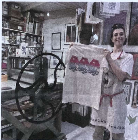
Acte 3 : une stagiaire heureuse du résultat de son impression sur tee-shirt.