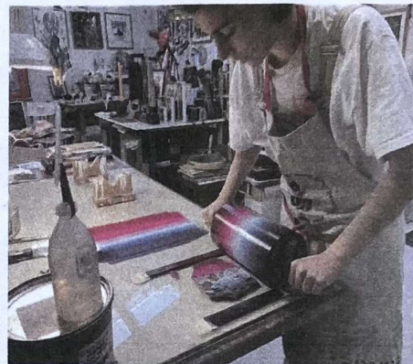
Acte 2 : un rouleau de dégradés de couleurs, guidé par des rails, imprègne le relief de la plaque.