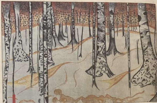
"Hiver" de Patricia Moran. Estampe de l'atelier des Artistes Indépendants Aixoïes.