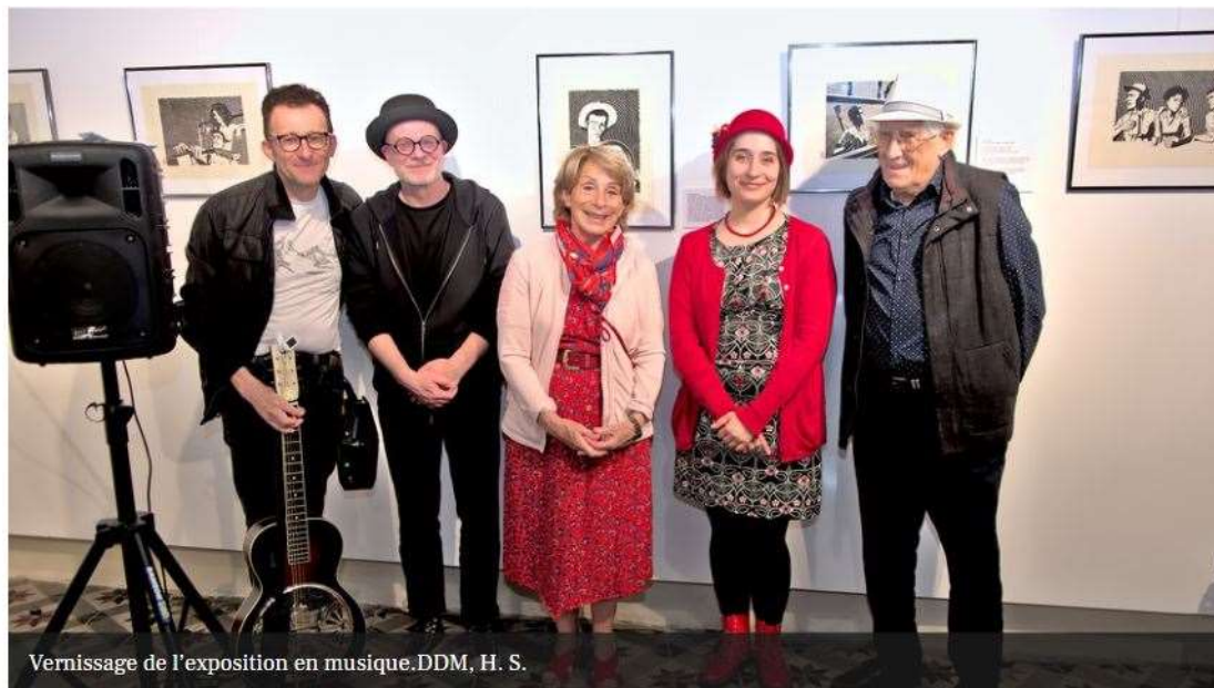
Vernissage de l'exposition en musique.DDM, H. S.