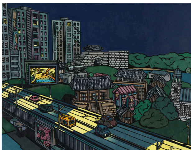
LEE UN JUNG (née en 1987), Ville Gimpo - nuit, 2022, gravure sur bois, monotype, 50 x 70 cm. M.C. 2023-43. Don de l'artiste, 2023.

D'autres optent à l'inverse pour une représentation du monde actuel adaptée à de nombreuses expérimentations techniques et stylistiques, qui génèrent une multiplicité d'effets. Cette variété se retrouve également dans de nombreuses œuvres basées principalement sur l'exploration d'un vocabulaire purement formel ou de l'expression de l'intériorité de l'artiste. La gravure, par la modicité des moyens nécessaires et la mise en œuvre souvent longue, apparaît en effet comme le vecteur privilégié d'un art intimiste.