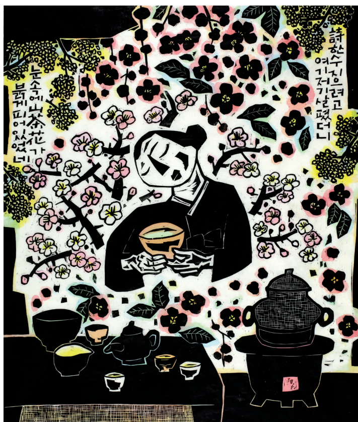
HONG SEON WUNG (né en 1952), Fleurs de Camélia , 2011, gravure sur bois, 142 x 121 cm. M.C. 2023-12. Don de l'artiste, 2023. Paris Musées / Musée Cernuschi, musée des Arts de l'Asie de la Ville de Paris

Pour son nouvel accrochage d'arts graphiques, le musée Cernuschi expose ce printemps une sélection d'œuvres contemporaines issue de son fonds de gravures coréennes.