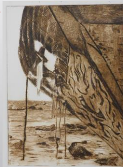
Pointe sèche – G Balichard

Il s'agit à l'aide d'un outil pointu de graver une plaque (zinc , Rhénalon ou Tetra-Pak) . La pointe sèche s'utilise comme un crayon et laisse une grande liberté de trait , les cisures réalisées dans la plaque produisent des aspérités appelées " barbes" . Après encrage , le tirage est effectué avec une presse . les gravures à la pointe sèche sont caractérisées par la douceur et l'aspect velouté.