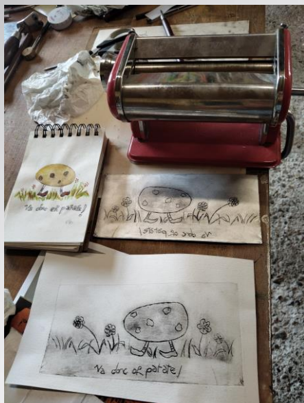
Impression d'élève à la machine à pâtes

2 supports très accessibles pour découvrir la pointe sèche: