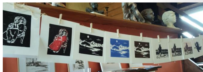
Réalisations d'élèves à l'atelier