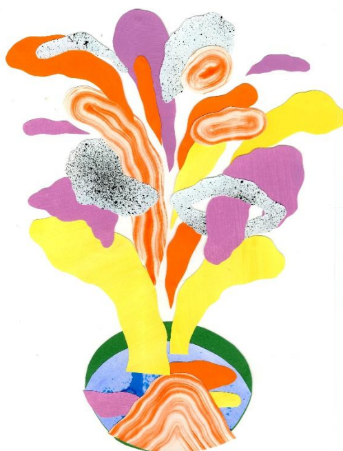
CROWTHER KITTY - FACE THE DAY / JACQUES BENOIT - LE COUREUR DES BOIS 4 / BROUILLARD ANNE - LA GRANDE FORÊT - BALADE EN FORÊT 36 / BRUGNI ANNE - PLAT DU JOUR3 (COUVERTURE)