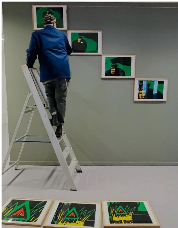
« Le petit chaperon rouge », sérigraphies de Joelle Pontseel.

Notre musée a souhaité reprendre et agrandir ce magnifique projet quelques estampes de sa collection.