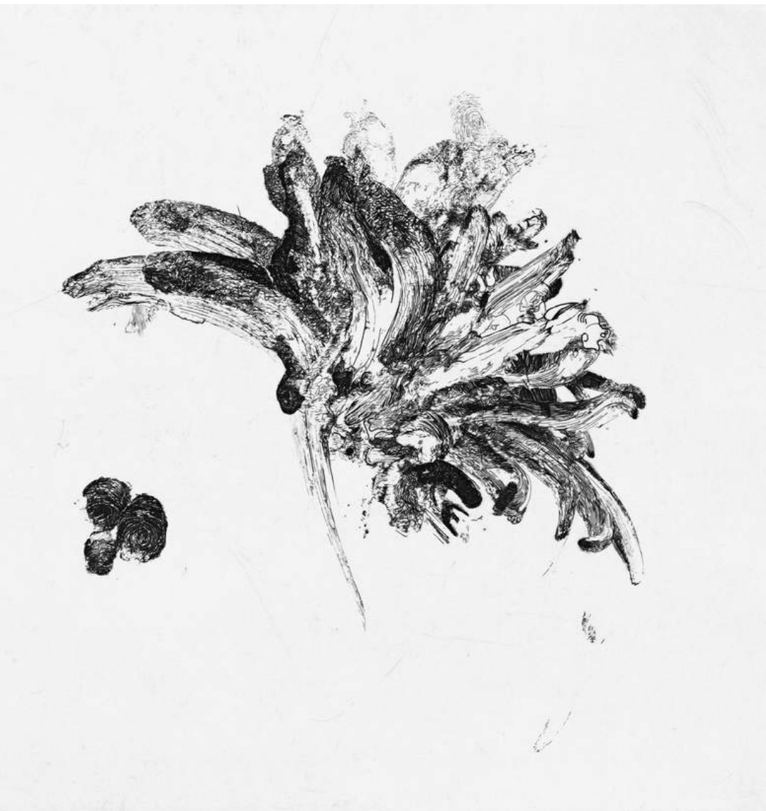
Au bout des doigts - Maria CHILLÓN Gravure au burin Papier 60 x 50 cm, 2015