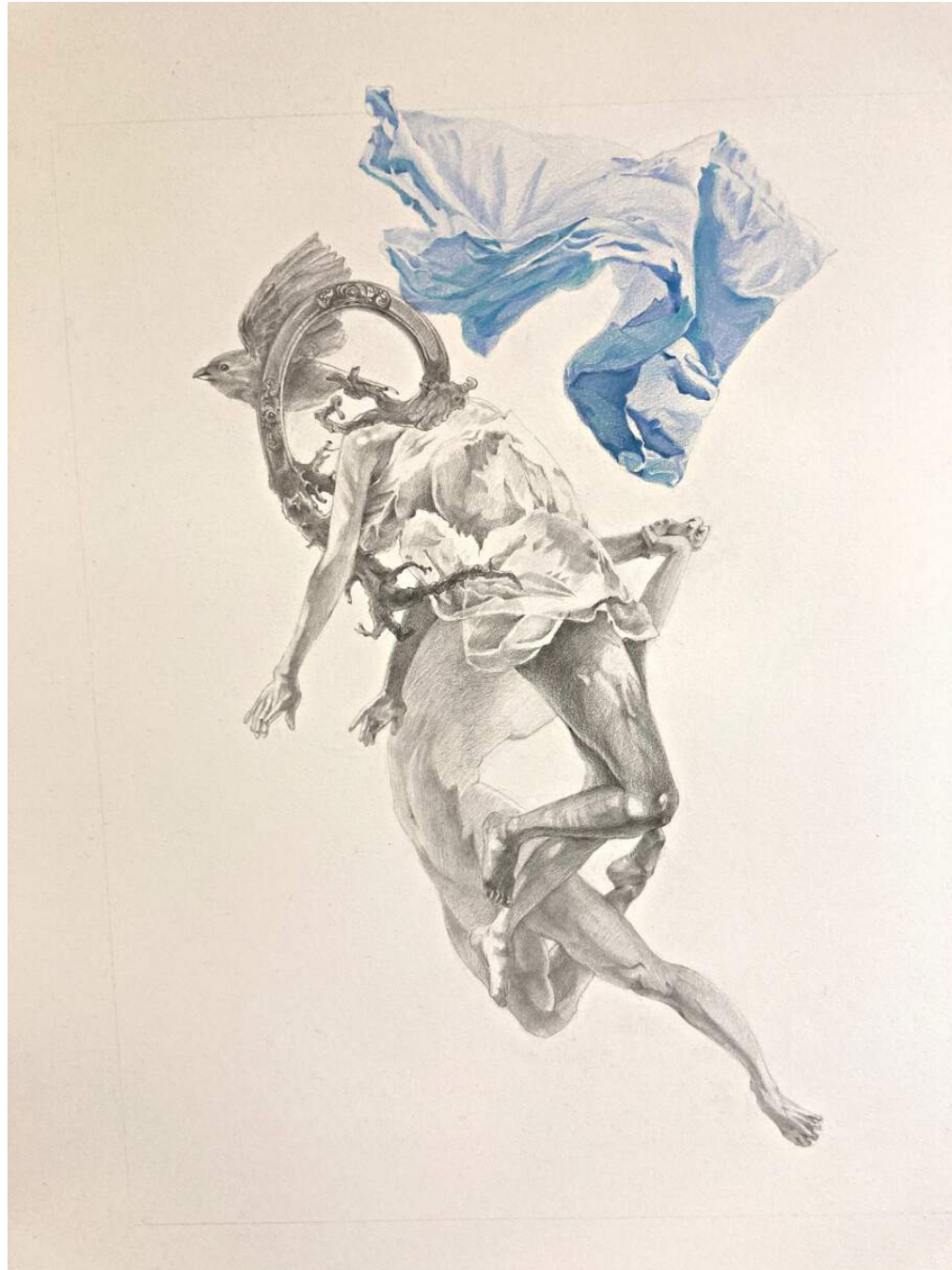
Dessin - Rong GUO 50X60 cm