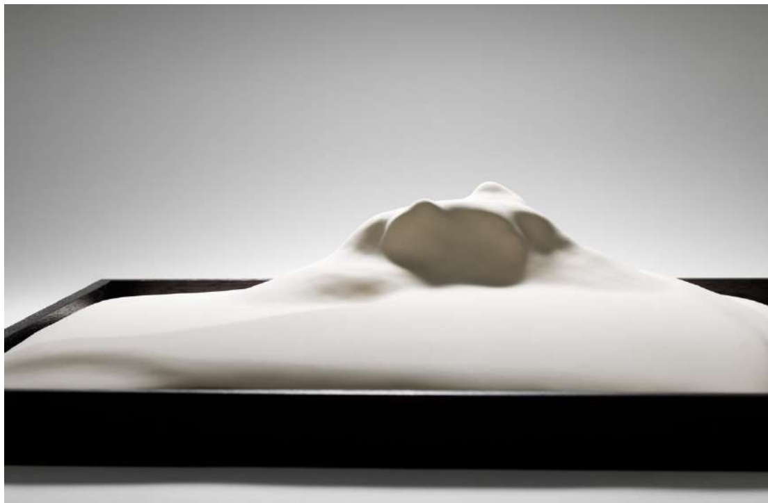
Undescape IV , céramique, 2020, 4 x 42x 42 cm