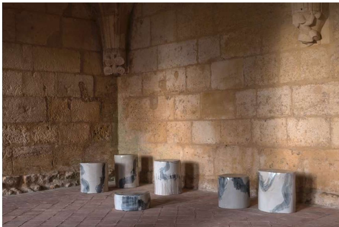
Échanges I à VII , grès émaillé, 2020, dimensions variables