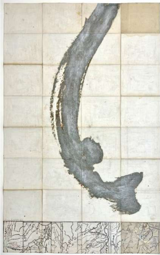
Nova descriptio XIV , estampe au carborundum sur carte ancienne, 2022, 82 x 52 cm

sur simple demande à contact@annepaulus.fr