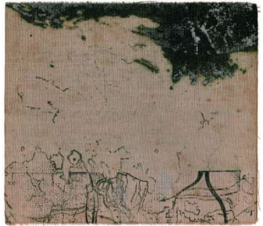
Traversée VII , estampe au carborundum sur fragment de carte ancienne, 2024, 20 x 20 cm