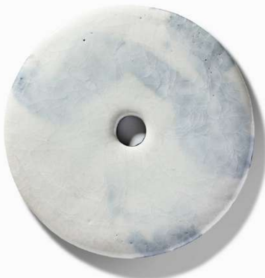
Bi III , céramique émaillée et estampe sur feutre de laine, 2023, diam 32 cm