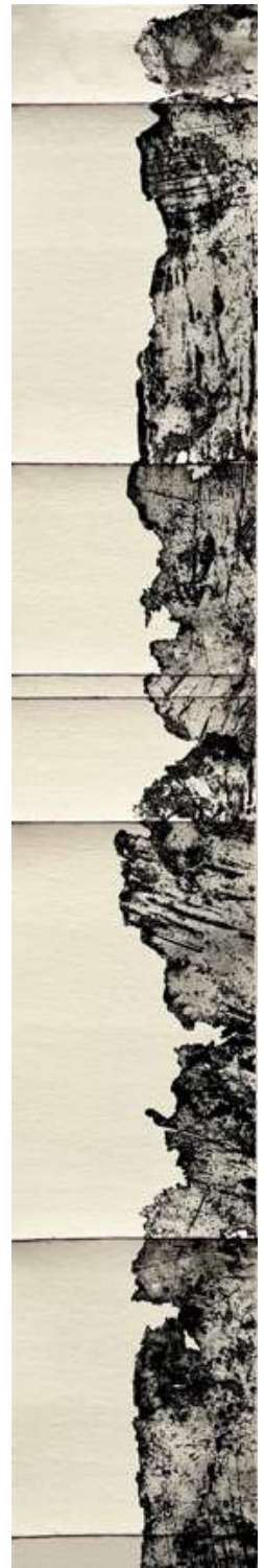
Edge XI , eau-forte sur feutre de laine 2024, 210 x 33 cm