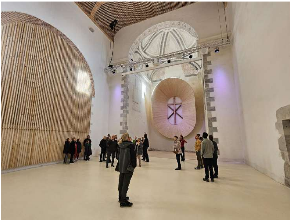
Vue de la chapelle devenue auditorium

Visites, expositions, spectacles et conférences offrent au public autant de possibilités de découvrir toutes les richesses de ce site chargé de quatre siècles d'histoire.