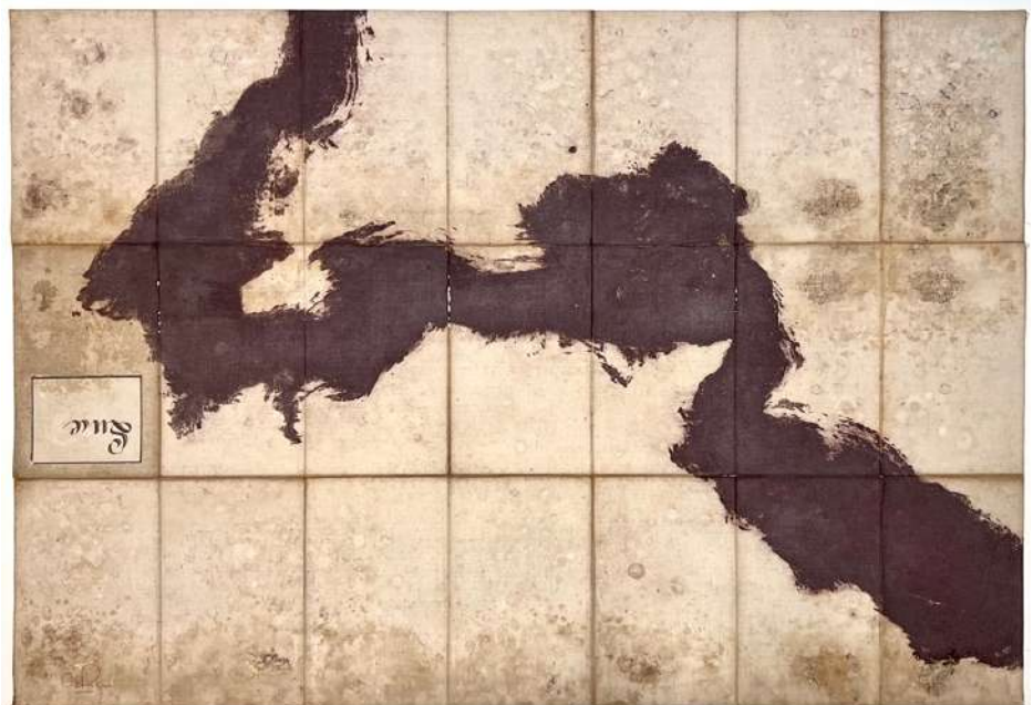
Nova descriptio IV , estampe au carborundum, sur carte ancienne, 2017, 60 x 87 cm