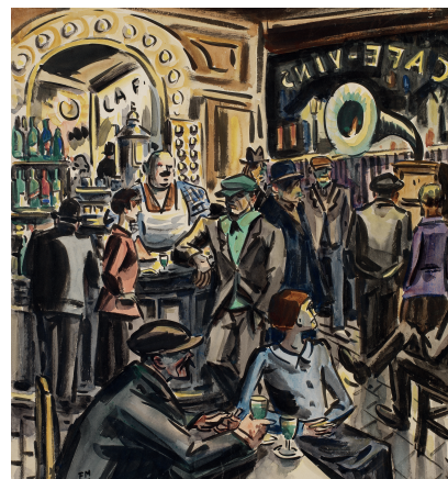
Le Petit café

Frans Masereel, gravure sur bois, 1924, coll. privée.