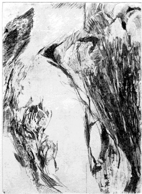
Carla Ferriroli, Il stato – Illustrazione per “La Caverna del Calcografo” , 2015, acquaforte, 160x115 mm

© Carla Ferriroli / foto Carla Ferriroli