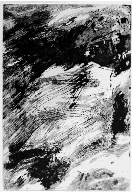
Carla Ferriroli, Rien que du blanc , 2025, maniera allo zucchero, acquatinta e acquaforte, 257x177 mm

© Carla Ferriroli / foto Carla Ferriroli