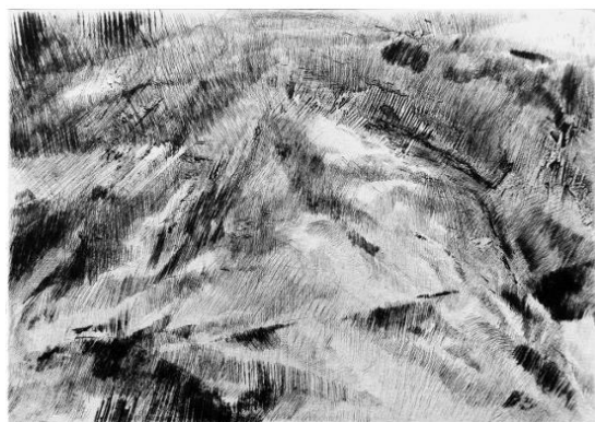
Carla Ferriroli, Variazioni geologiche 8 , 2025, tecnica mista in calcografia, 150x210 mm © Carla Ferriroli / foto Carla Ferriroli