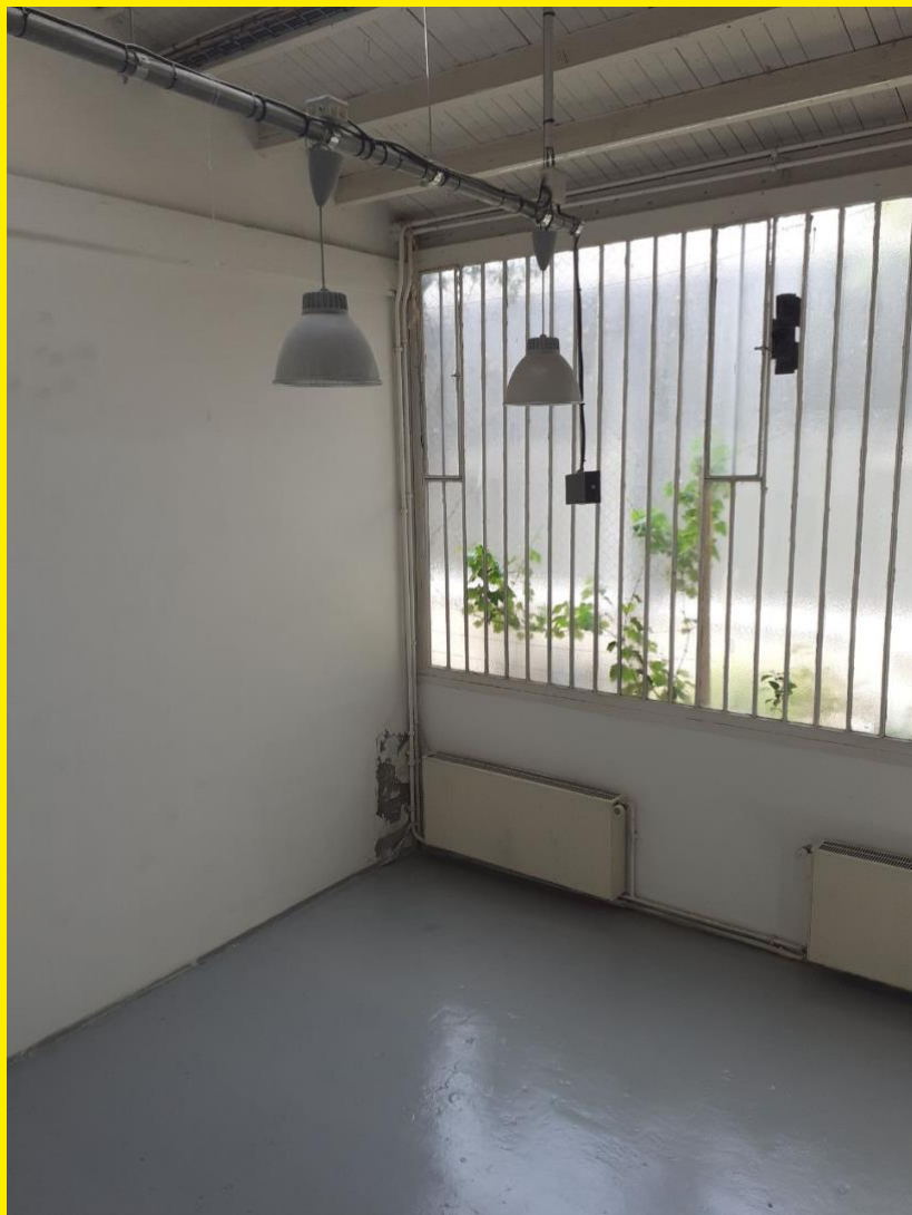
Un atelier type des allées