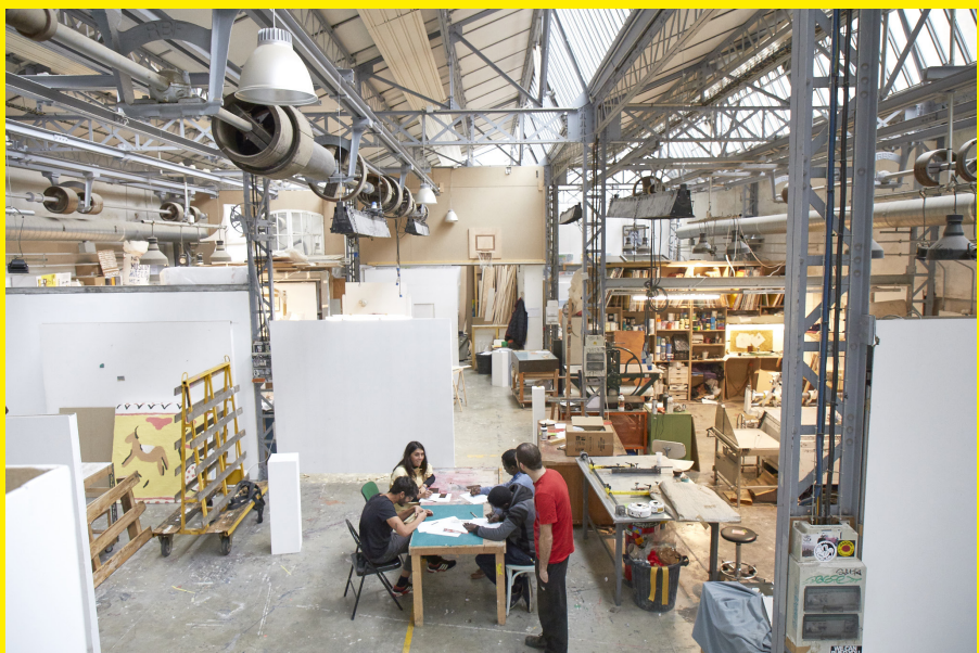
Espaces de travail de l'Usine